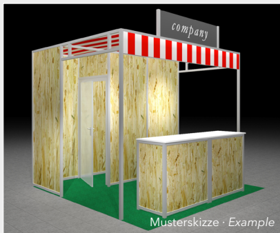
Musterskizze · Example