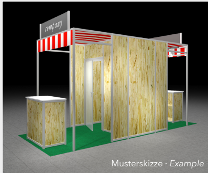
Musterskizze · Example

Please order the required stand construction package with the application form.